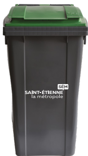
Bac ordures ménagères

Le fourniture des bacs collecte sélective est une prestation gratuite .