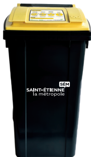
Bac collecte sélective